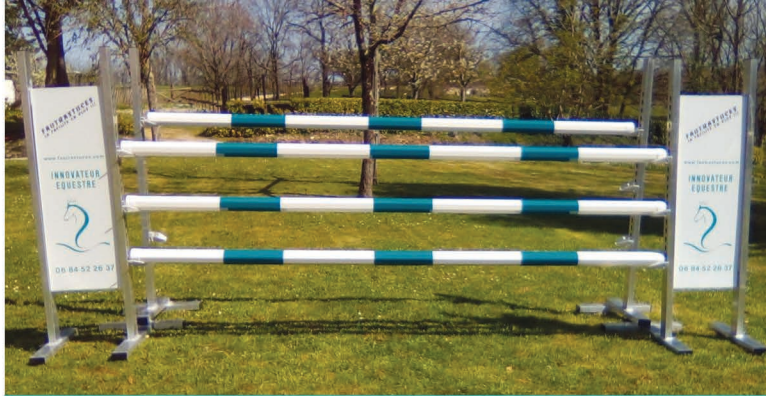
Oxer avec barre de 3 m ou 3,50 m