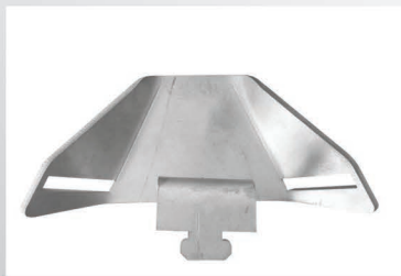
Vue de dessus