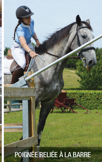
POIGNÉE RELIÉE À LA BARRE